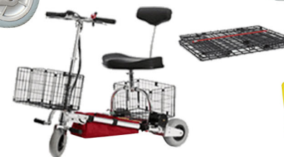
Cesto de compras