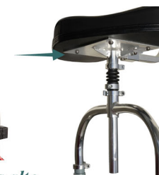
Suspensão de assento