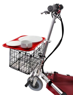
Kit viagem cruzeiro