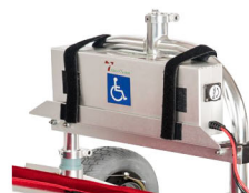
porte de bateria mais alto