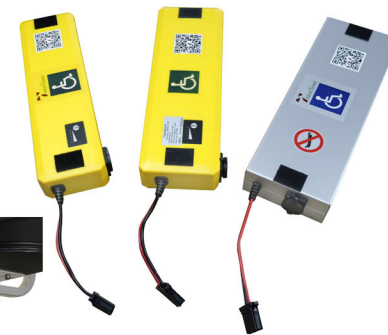
3x diferentes tipos de baterias lithium disponíveis