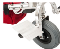
Placa de pés