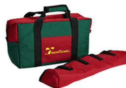
Kit viagem aérea