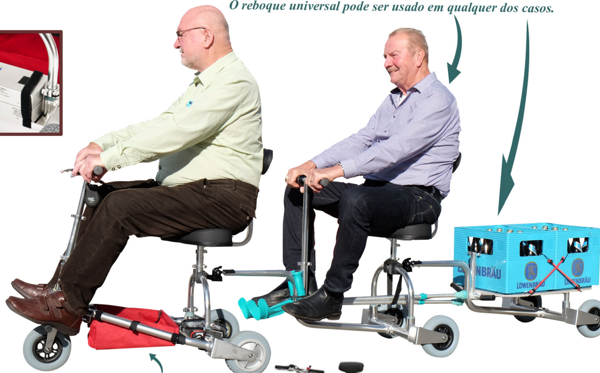
Para bagagem leve